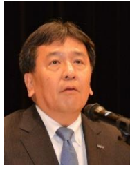
枝野幸男 立憲民主党代表