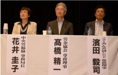
実行委員会構成団体代表のみなさま

関係を持つていっているとこは魂の入った改革が可能です」「政治も有権者が主役になつていのだろうか。今の野党の動きを支えたいと思います」