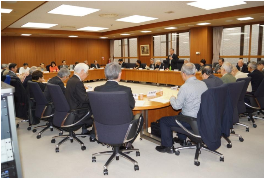
▲熱心な議論で3時間を超える会議となった第4回幹事会。(3月17日、連合本部8階三役会議室)

退職者連合は、三月十七日(火)午後一時半から、連合本部八階三役会議室で第四回幹事会を開催しました。会議では、七月に開催予定の第九回定期総会に向けた「二〇一五年度運動方針」と「政策・制度の年度要求」、「低所得高齢単身女性