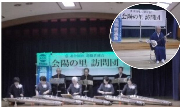
情報労連の箏と尺八。円内はJR連合の三味線

12月4日(火)岡山市東区の特養「会陽の里」を訪問し、入所・通所者40名の前で日頃鍛えた技能を發揮され披露されました。全印刷のどじょう掬い・剣詩舞、JR連合から三味線の演奏、情報労連から箏と尺八の演奏と大変喜ばれました。