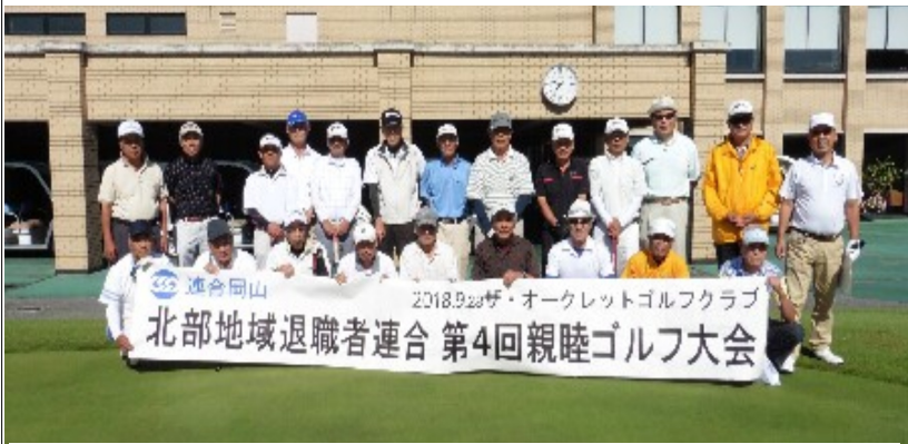
元千尾北部会長の挨拶を受けスタート前に全員集合