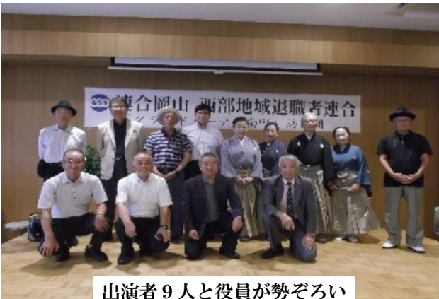
出演者9人と役員が勢ぞろい

9月20日(木)倉敷の「グランドガーデン南町」が開催する「敬老会」に今年も伺いました。入所者60名の前で、UAゼンセンのギターと歌、JJP労組の4人による剣詩舞、JR総連のマジック等日頃鍛錬されている技能を大いに發揮されました。