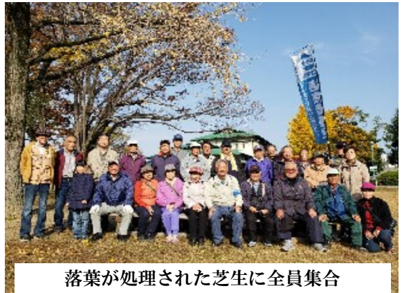
落葉が処理された芝生に全員集合