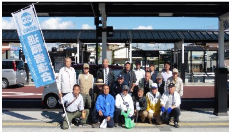
市内ボランティア清掃に集まった皆様：津山駅前