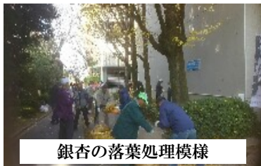
銀杏の落葉処理模様

12月2日(日)三大名園の後楽園に東部退連から会員とその家族33名が集まり、他の団体と合流し、総勢200名の一団として参加しました。