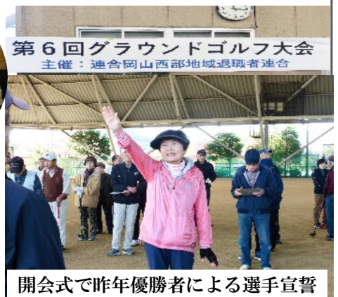
第6回グラウンドゴルフ大会 主催：連合岡山西部地域退職者連合