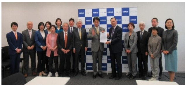
人見会長より大島企業団体交流会委員長に要請書を手交 対応していただいた立憲民主党の議員、秘書、事務局の皆さん

2月8日に衆議院第一会館内において全国から約250名が参加する院内集会を開催して、要求実現に向けた取り組みを確認してきました。 本日は、集会での確認を踏まえて要求実現に向けて協力要請にまいりましたので、是非国会内での議論を展開していただくようよろしくお願いいたします。 とくにマイナ保険証導入にあたっては、現行の健康保険証廃止の撤回を求めて団体署名を取り組んできたが、今年12月に廃止することが閣議決定された。私たちがDX等に反対ではないが、移行にあたって国民の不安や関係職場での混乱を解消して丁寧に進めることを求めて、地方議会から政府に対する意見書提出の取り組みを進めているので、各地域での協力をお願いしたい。