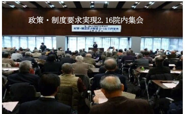
政策・制度要求実現2. 16院内集会

2月16日(木) 昨日の会議出席者に関東ブロック会員を含め300人が参議院議員会館の講堂に集し、「社会保障制度に関する2017年春の要求」実現に向け取り組みを強化することを確認した。連合、民進党、社民党から連帯の挨拶を受けた。