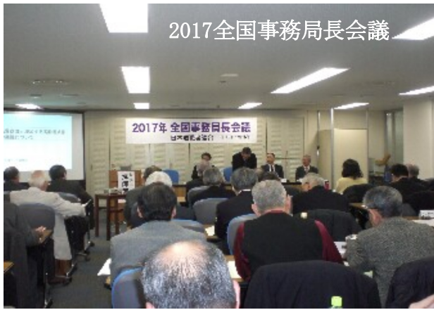
2017全国事務局長会議