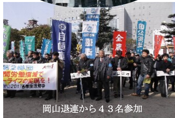
岡山退連から43名参加