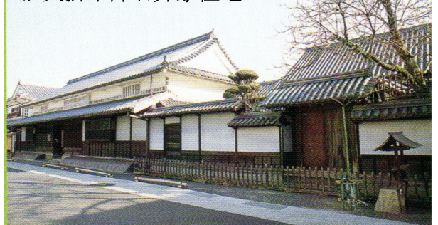
旧矢掛本陣石井家住宅

石井家は屋号を佐渡屋といい、庄屋を務めるとともに酒造業を営み矢掛町筆頭の豪商であり大地主でもありました。本陣施設の御座敷と主屋を合わせた規模は130坪に及び日光街道等の主要な街道の本陣規模とほぼ同じであります。