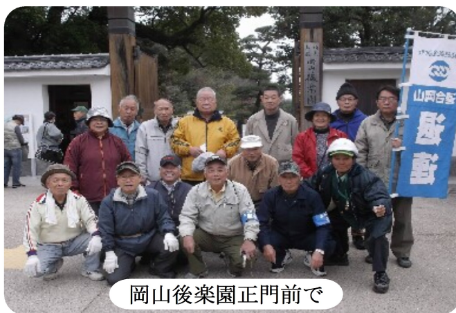
岡山後楽園正門前で

岡山後楽園が、一斉清掃にボランティアで参加する「キラリ応援隊一日隊」を募集しており一昨年に引き続き昨年末岡山退連として二年連続参加した。当日は、私達20名をはじめ、会社の団体、老人会、幼稚園児達等多数参加して園内・外の落ち葉を中心にかけ集め、見違えるようにキラリと。