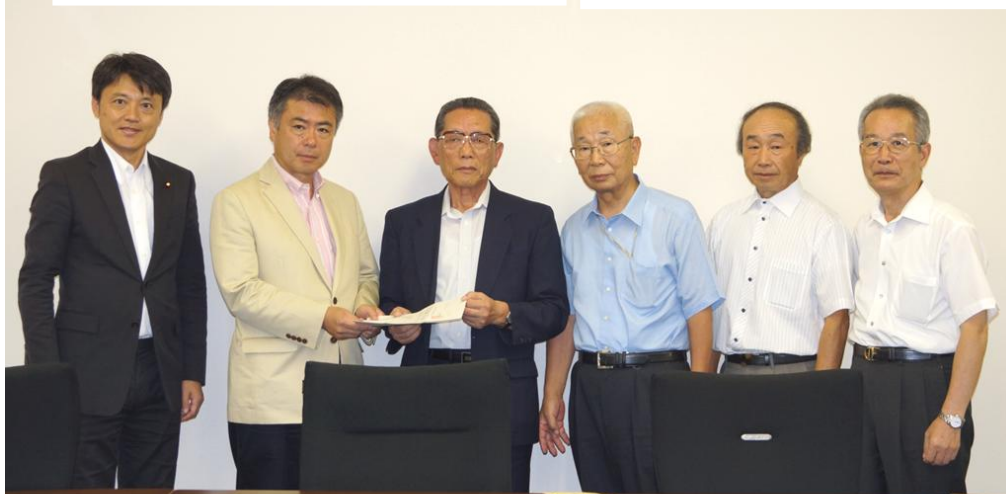
△写真左から古本税調事務局長、桜井政調会長、阿部会長、羽山事務局長、太田委員長、菅井事務局次長