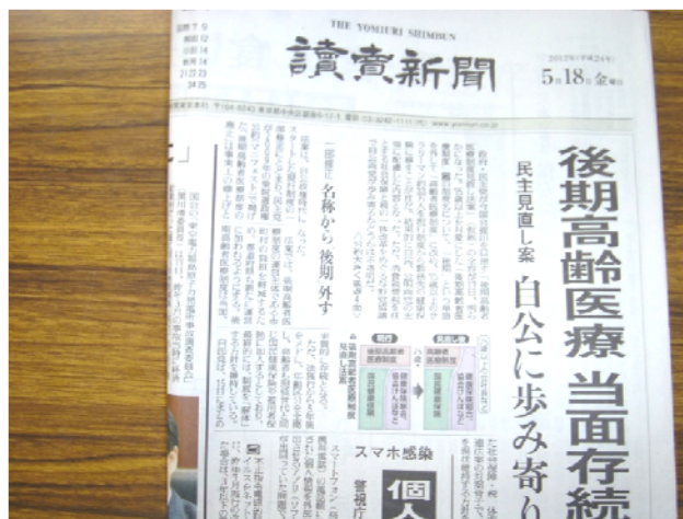
(5月18日読売新聞朝刊1面)

るのは非常に厳しい状況にあるのは事実である。将来のことは厚労省の事務方としてはこれ以上のことは言えません」とのことでした。