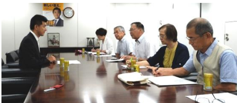
←立憲民主・長妻昭 代表代行・佐々木隆博 副代表に要請