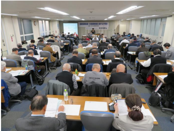
▲会員90人が参加して会場を埋めた学習会。(11月29日、連合会館3階・連合AB会議室)

<TEL> 03-5295-0507<FAX> 03-5295-0541<e-mail> ntr@sv.rengo-net.or.jp